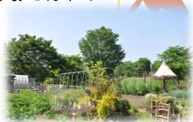
里山ホテルのボタジェ(菜園)でとれた野菜を使った贅沢ランチ!

新緑の中での第1弾に引き続き! 色とりどりの美しい紅葉の下でアクティブに! 素敵な恋, 探しませんか?